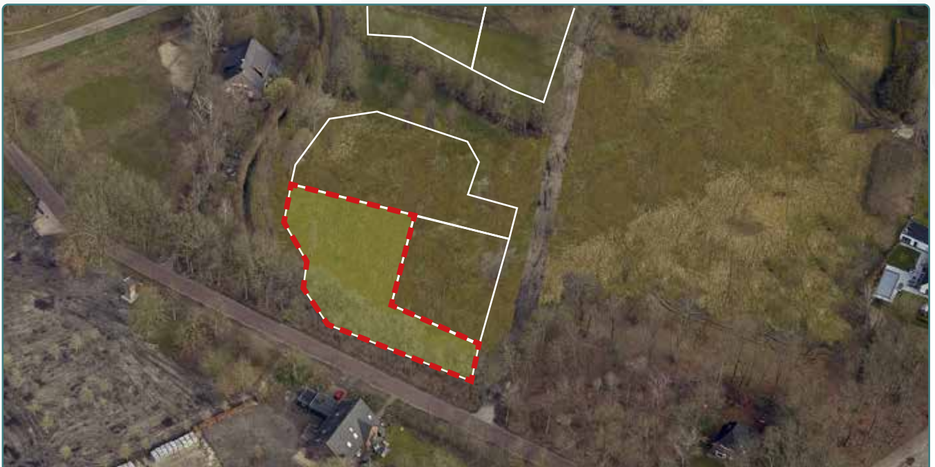
Kavel 160 vanuit de lucht