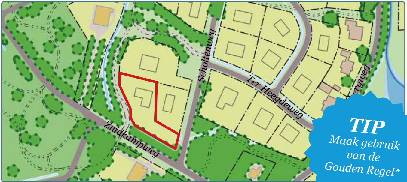
Situatietekening kavel 160